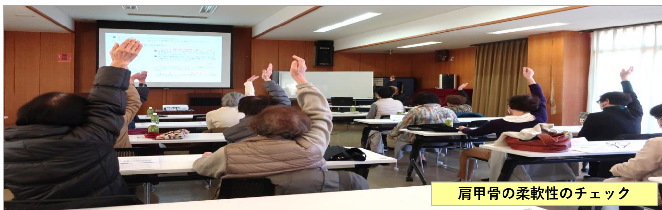
肩甲骨の柔軟性のチェック

当たり前に行っていたことが、人の手を借りなくてはならなくなること、体が自由に動かさないことは、頭の中で想像するよりも何倍もつらく悲しい出来事です。⇒ 寝たきりになった人の言葉です。