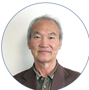
宮の森区 山内区長

昨年は、丸4年のコロナウィルスも下火となってきたものの、気の抜けない状態であり、アメリカでは次期大統領の選出、またロシア・ウクライナ戦争等々の不安定要素が多々あったりします。そのような中で東寺区は、各団体や個々との連携を密に昨年同様、様々な行事やイベントに取り組んで行きたいと思っています。本年が良い年となることを心から願っております。