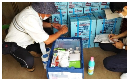
石部南まちづくりセンターの防災倉庫

備蓄品に期限切れはなく、適切に管理されていました。災害時における避難所の開設と運営に防災倉庫の有効な活用が期待されます。