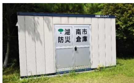
石部南小学校の防災倉庫