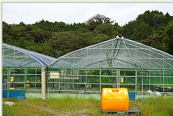
ファームかがやき