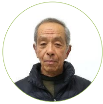
石部南区 土居区長

新年あけましておめでとうございます。 令和二年になり、住民の皆様方は新しい年をいかがお過ごしでしょうか。石部南区自治会では、昨年は、初めて親子で参加出来る行事を企画し、大変好評でしたので今年度も継続して実施することを検討しております。